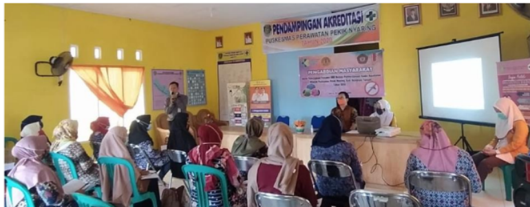
Gambar 3. Penyampaian Materi untuk meningkatkan pengetahuan Kader Jumantik tentang Pencegahan DBD

Pada tanggal 5 September 2020 dilakukan pelatihan bagi Kader jumantik tentang upaya pencegahan penyakit DBD. Pada kegiatan tersebut selain diikuti oleh kader jumantik lama dilatih juga beberapa kader jumantik yang baru dengan jumlah total peserta 24 orang. Pada pelatihan tersebut juga dibagikan buku saku dan leaflet tentang upaya pencegahan penyakit demam berdarah dengue.