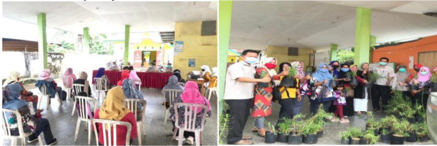
Gambar 6. Pembudidayaan dan pendistribusian tanaman lavender

Pada tanggal 21 September 2020 tim melakukan pendistribusian tanaman anti nyamuk yaitu tanaman lavender, serai wangi dan yudistira sebanyak 200 polibag kepada kader yang telah dilatih. Tanaman tersebut selanjutnya dilakukan pembudidayaan oleh kader untuk kemudian dibagikan ke masyarakat desa pekik nyaring terutama yang banyak terdapat nyamuk DBD.