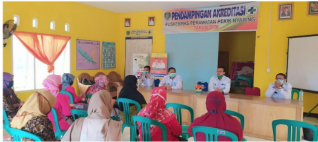
Gambar 4. Persiapan kegiatan Survey Jentik

Pada tanggal 10 September 2020 dilaksanakannya kegiatan survei jentik di wilayah puskesmas Pekik Nyaring yang diikuti oleh seluruh tim pengabmas, mahasiswa dan kader. Pada kegiatan tersebut dilakukan pemberdayaan kader yang sudah dilatih untuk survei awal jumlah jentik di salah satu desa yang paling banyak kasus DBD.