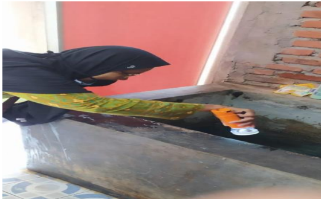
Gambar 5. Kegiatan Survey Jentik yang dilakukan oleh kader Jumantik