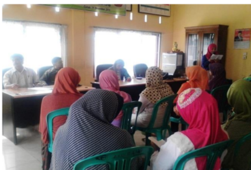
Gambar 1. Peserta pembentukan kelompok "Home Industri Sehat"

Kondisi masalah kesehatan pekerja industri yang terjadi saat ini yaitu sering terjadi luka bakar ringan, adanya kasus anemia, belum terpaparnya edukasi penanganan pertama pada kecelakaan kerja, dan perlindungan dengan Alat Pelindung Diri (APD) saat bekerja serta penempatan posisi dan pakaian khusus saat bekerja. Hal ini dapat dilakukan dengan pembinaan lanjutan.