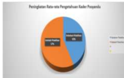
Pre dan Post Test Kemampuan Kader Posyandu Desa Sido Mulyo Kecamatan SulaRaja Kab Seluma

b. Gambaran Peningkatan Pengetahuan, Sikap dan Keterampilan ibu balita setelah diberikan materi dilakukan pendampingan oleh Kader Posyandu desa SidoMulyo Kecamatan Sukaraja Kabu[at]aten Seluma.