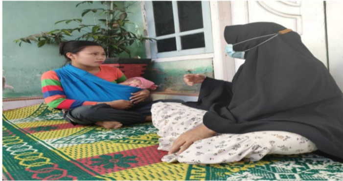
Gambar 3. Pendampingan Kader terhadap Ibu Bayi