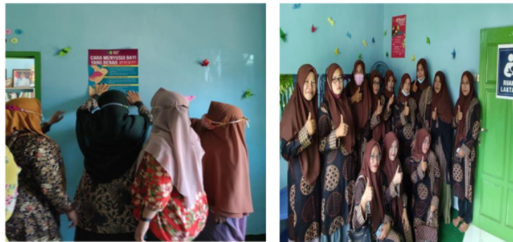
Gambar 4. Ruang Menyusui

Pembentukan ruangan untuk menyusui di Posyandu