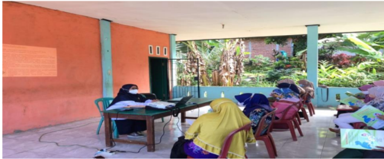
Gambar 2. Pelatihan kader “SAHABAT”

Hasil pengetahuan kader sebelum dan setelah diberi pelatihan dapat dilihat pada tabel 1.