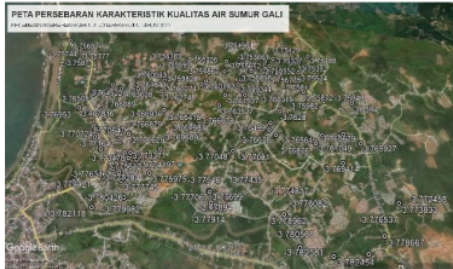
Gambar 1. Peta Sebaran Karakteristik Kualitas Air Sumur Gali

Berdasarkan gambar diatas, teridentifikasi bahwa total jumlah keseluruhan lokasi pengamatan sumur gali dilapangan adalah 150 sumur. Pengamatan