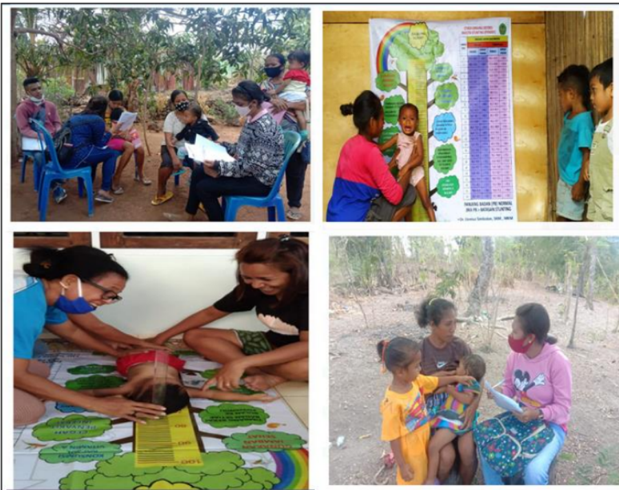
Gambar 4. pendampingan ibu baduta stunting di Kampung KB Kota Kupang