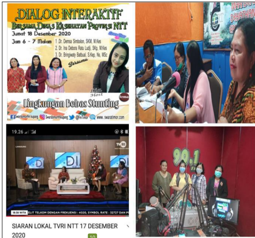
Gambar 5. Sosialisasi hasil kegiatan pengabdian kepada masyarakat

Setelah kegiatan pengabdian kepada masyarakat selesai dilaksanakan, diperoleh rencana tindak lanjut yang disepakati antara Petugas Puskesmas, kader kesehatan dan tim Pengabdian kepada masyarakat. Kader yang terbentuk dibina dan dilibatkan dalam kegiatan-kegiatan pemberdayaan masyarakat di wilayah kerja puskesmas. Kader bertanggung jawab melanjutkan kegiatan pada kelompok sasaran sampai berusia 5 tahun dengan pembinaan oleh tenaga kesehatan di Puskesmas dan Posyandu. Membuat jadwal pendampingna secara berkala sampai anak berusia 5 tahun