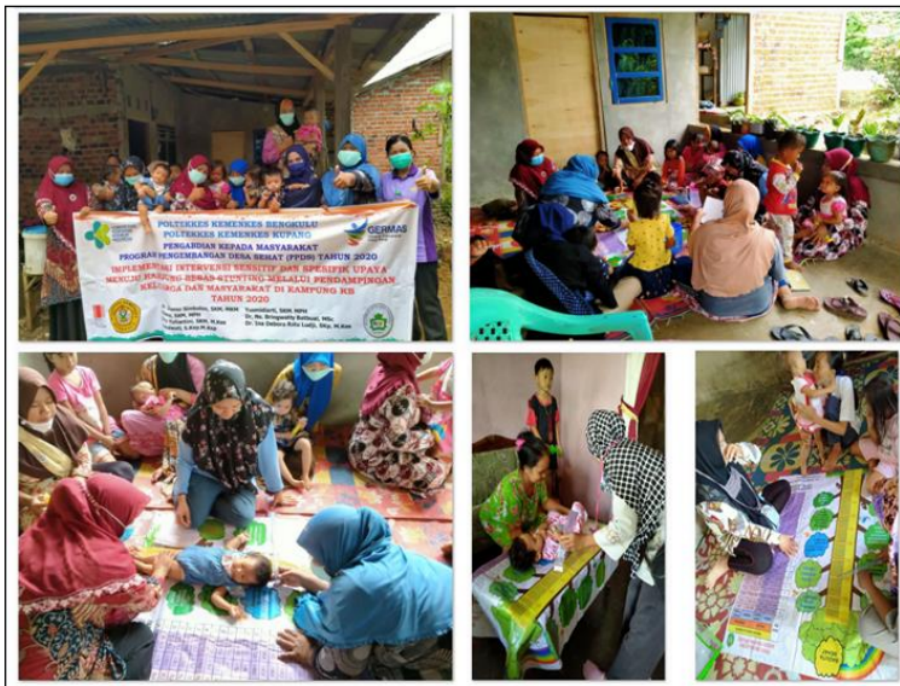
Gambar 3. Pendampingan ibu baduta stunting di Kampung KB Kota Bengkulu