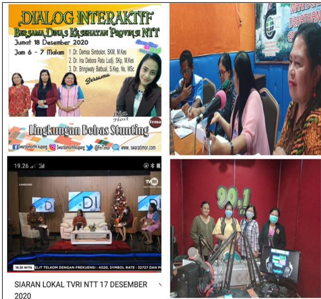
Gambar 5. Sosialisasi hasil kegiatan pengabdian kepada masyarakat

Setelah kegiatan pengabdian kepada masyarakat selesai dilaksanakan, diperoleh rencana tindak lanjut yang disepakati antara Petugas Puskesmas, kader kesehatan dan tim Pengabdian kepada masyarakat. Kader yang terbentuk dibina dan dilibatkan dalam kegiatan-kegiatan pemberdayaan masyarakat di wilayah kerja puskesmas. Kader bertanggung jawab melanjutkan kegiatan pada kelompok sasaran sampai berusia 5 tahun dengan pembinaan oleh tenaga kesehatan di Puskesmas dan Posyandu. Membuat jadwal pendampingnya secara berkala sampai anak berusia 5 tahun