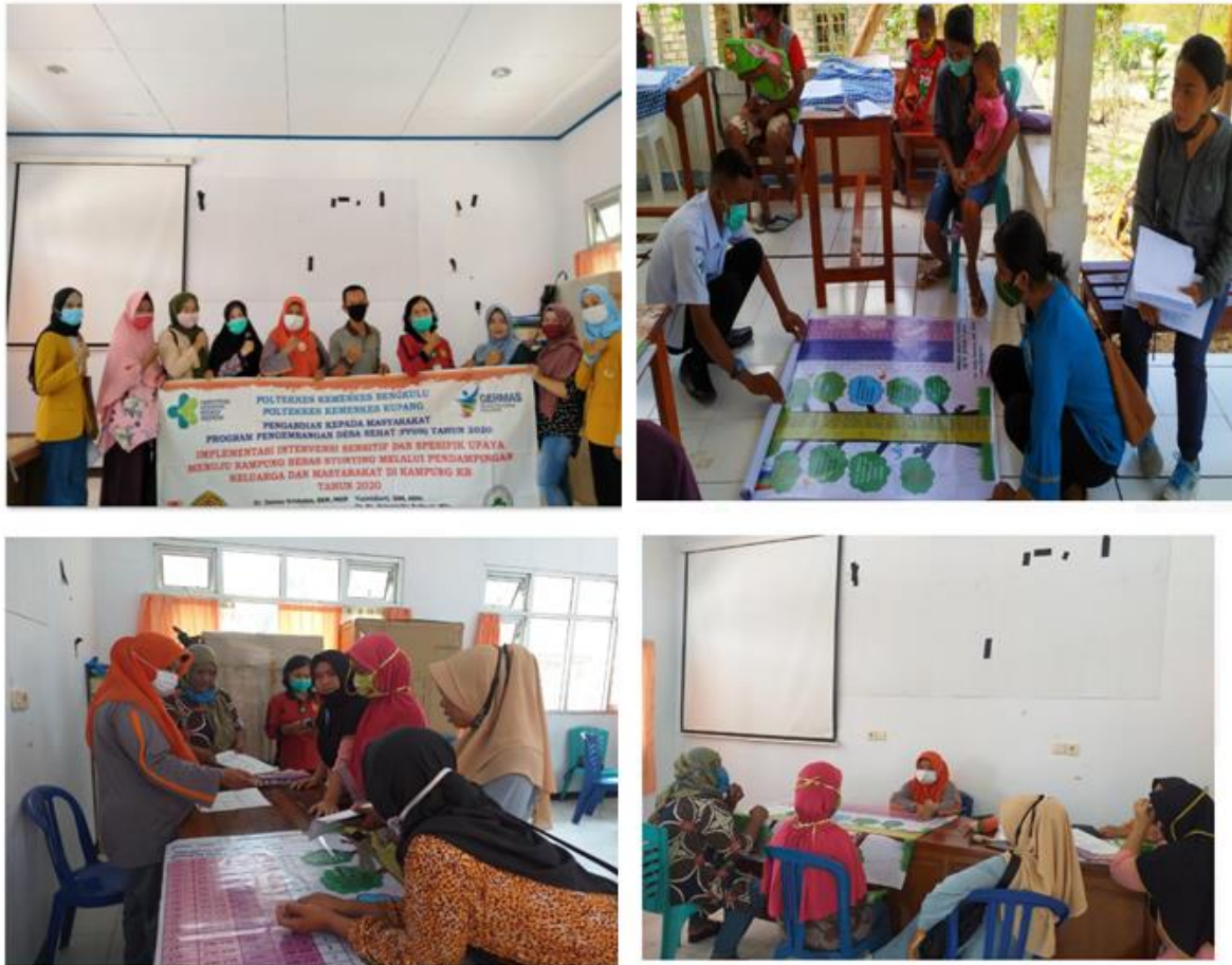
Gambar 2. Pembentukan dan pelatihan Kelompok Kader Ibu Baduta

(MDRS). Pelatihan juga bertujuan untuk penguatan peran kader ibu baduta dan peningkatan kemampuan kader dalam melakukan pendampingan pada ibu baduta stunting usia 0-24 bulan. Gambar 2 menunjukkan kegiatan pembentukan kelompok kader ibu baduta dan kegiatan pelatihan. Pelaksanaan Kegiatan Pengabdian Masyarakat ini pada massa pandemic COVID-19, sehingga untuk diskusi selama kegiatan pendampingan dibentuk group diskusi melalui What App Group (WAG).