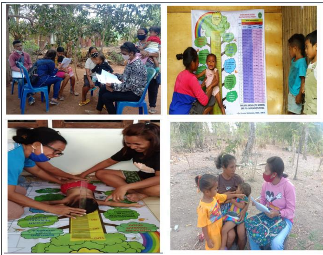
Gambar 4. pendampingan ibu baduta stunting di Kampung KB Kota Kupang