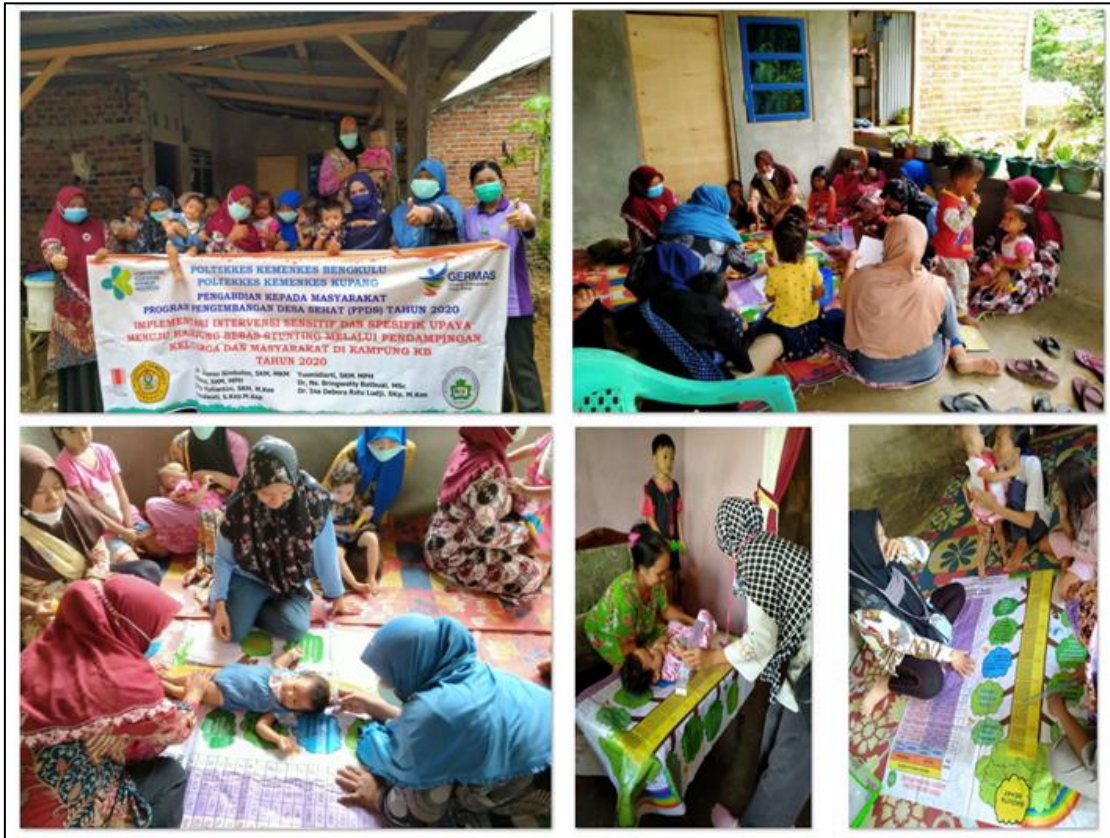
Gambar 3. Pendampingan ibu baduta stunting di Kampung KB Kota Bengkulu