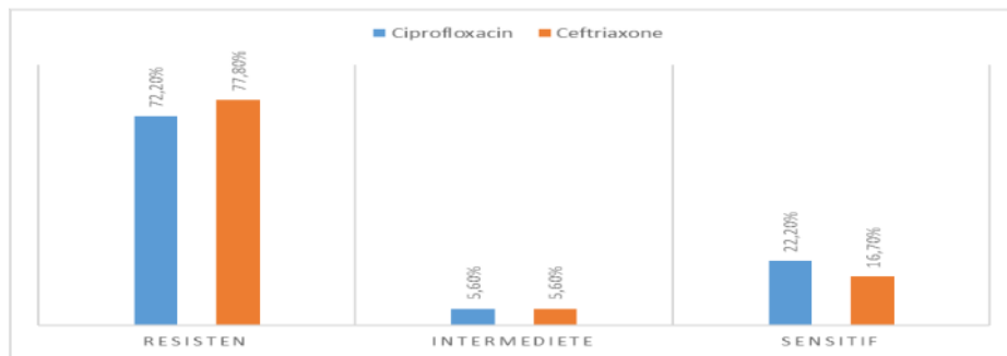
Gambar 3 Persentase sensitifitas antibiotik terhadap bakteri penyebab infeksi saluran kemih

(77,8%), dan sebagian kecil yang masih sensitif (16,7%) terhadap bakteri yang menyebabkan penyakit ISK (Gambar 3). Pada penelitian lain dinyatakan bahwa sensitifitas ciprofloxacin dan ceftriaxone kecil yaitu 11-25% (16).