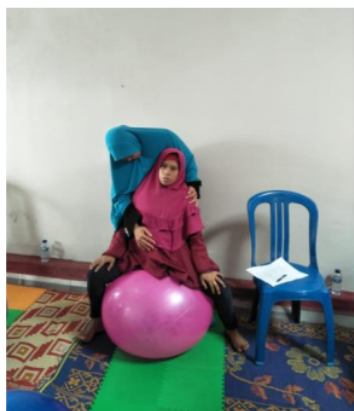
Gambar 5. Bidan mengajarkan senam hamil birth ball

Bidan yang mengajarkan ibu hamil senam birth ball terlihat semangat dan begitu sabar mengajarkan ibu hamil, terlebih ibu hamil yang merasa takut untuk pertama kali duduk diatas bola. Beberapa ibu hamil bahkan antusias dengan senam hamil birth ball dan merasa nyaman duduk diatas bola.