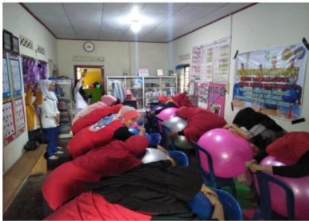
Gambar 3. Praktik senam hamil Birth ball

Tahap kegiatan selanjutnya setelah simulasi adalah pelatihan senam hamil birth ball . Para peserta dalam hal ini adalah bidan diberi waktu untuk membaca kembali buku panduan senam hamil birth ball untuk selanjutnya mempraktikkan secara langsung senam hamil birth ball .