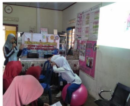
Gambar 2. Simulasi senam hamil birth ball

Dalam pelaksanaan kegiatan, setelah penyampaian materi oleh narasumber. Selanjutnya dilakukan simulasi senam hamil birth ball oleh mahasiswa Prodi Kebidanan Curup.