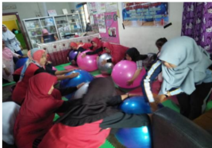
Gambar 4. Pelatihan senam hamil Birth ball

Dalam pelaksanaan pelatihan senam hamil birth ball , narasumber menilai keterampilan bidan dengan menggunakan daftar tilik penilaian. Setiap bidan dinilai kemampuannya dalam melakukan senam hamil birth ball . Hal ini berkaitan dengan kemampuan bidan untuk dapat mengajarkan senam hamil birth ball pada ibu hamil. Hasil penilaian